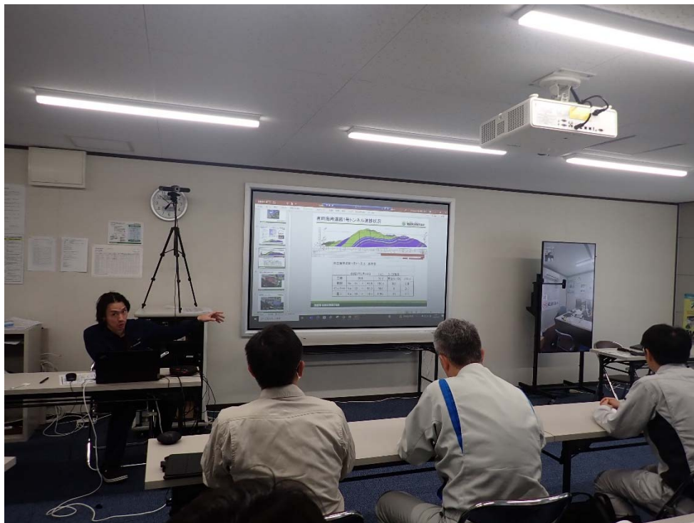
東急建設 一安 様による工事説明状況